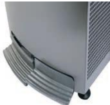
Distribution de l'eau à pédales

Removable stainless steel water outlets with sanitary protection