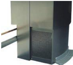
Découpe au dos de la fontaine pour le passage des tuyaux

Compatible avec le système anti-fuite Watersafe® (en option) Compatible with Watersafe® system (in option)