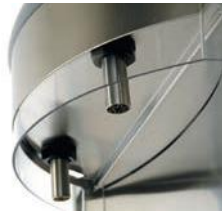
Sorties d'eau amovibles en inox avec protection sanitaire

Removable stainless steel water outlets with sanitary protection