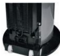
Roulettes de transport intégrées

The Carbon block filtration kit 100% hygienic 5000L water treatment