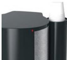
Témoin d'usure du filtre + distributeur de gobelets inversé

Lifetime filter indicator and inverted cup dispenser