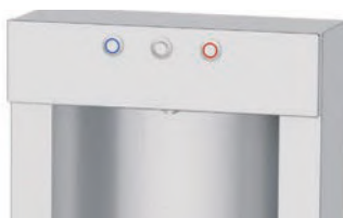
3 boutons électriques pour la distribution d'eau

3 electric buttons for water distribution