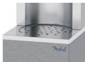
Grille inox pour carafes

3 electric buttons for water distribution